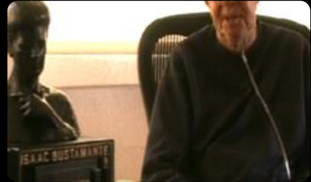
Simposio Internacional: La Computación en la Educación Infantil

“Contribuir a que todos los niños de todas las clases sociales, tengan acceso a los beneficios intelectuales y emocionales que pueden brindar las computadoras”.