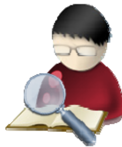
Editor de sección