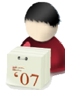
Administrador de Subscripciones