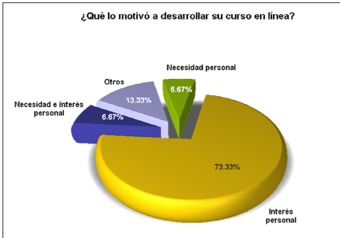
Motivación de los docentes por desarrollar cursos en línea.

En relación a la experiencia de cada docente, se plantean la necesidad de explorar modalidades alternativas (en este caso, no presenciales) implementando metodologías de aprendizaje diferentes. Delors menciona que a lo largo de su existencia, los profesores tendrán que actualizar y perfeccionar sus conocimientos y técnicas.